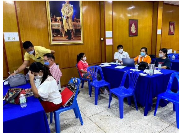
5. ภาพกิจกรรมการศึกษาดูงาน