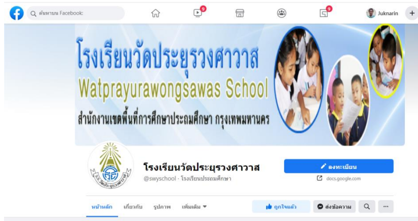
ช่องทางแจ้งเรื่องร้องเรียนทางข้อความ facebook ของโรงเรียนวัดประยูรวงศาวาส