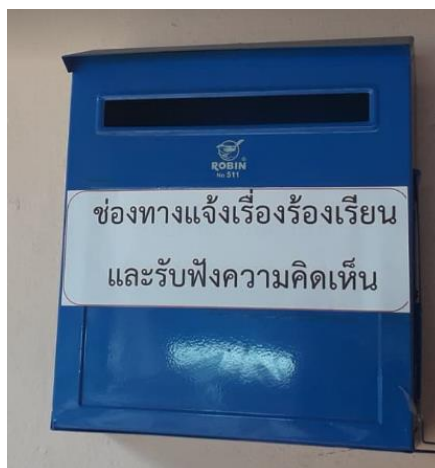
ช่องทางแจ้งเรื่องร้องเรียนทางช่องทางแจ้งเรื่องร้องเรียนและรับฟังความคิดเห็น